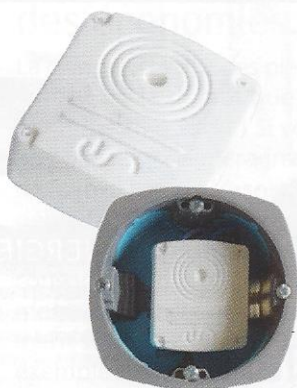
▲ Module Wattcube Wattlet.

Marché en plein essor, la domotique n'est plus réservée aux riches. Elle peut s'installer progressivement en fonction des besoins du quotidien et trouve même une application sociale puisqu'elle peut favoriser l'autonomie des personnes dépendantes. Mais, si les avantages offerts par la domotique ne sont plus à démontrer, il est bon d'évaluer précisément les économies d'énergie engendrées. Avec un système de chauffage moderne qui gère les zones et les heures de consommation, vous maîtrisez déjà vos dépenses. Il faut un certain nombre d'années pour amortir le prix d'une installation domotique et des modules accessoires. Dans tous les cas, la domotisation ne se substitue pas à la conception "intelligente" de l'habitat : isolation, orientation, gestion de la lumière, emploi de matériaux adaptés... ■